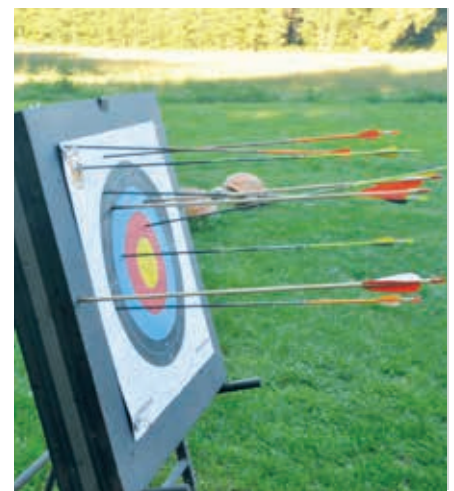
Beim gemeinsamen Bogenschießen üben sich die Teilnehmer:innen in Präzision.