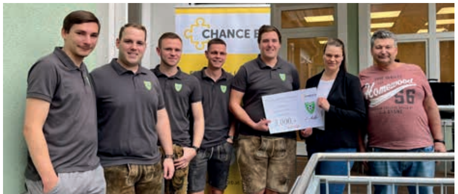
Spendenübergabe des Stammtisch Hösele.

Es war ein rundum gelungenes Fest, für das sich die Chance B Teams über ihre regulären Aufgaben hinaus mit großem Engagement tatkräftig eingebracht haben.