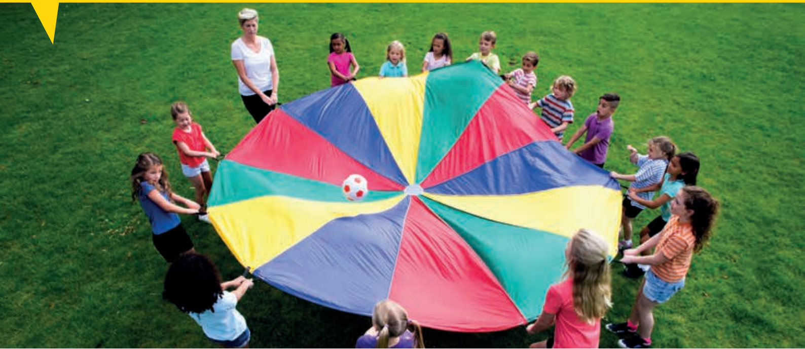
Inklusion sollte auch in der Sommerbetreuung gesichert sein.