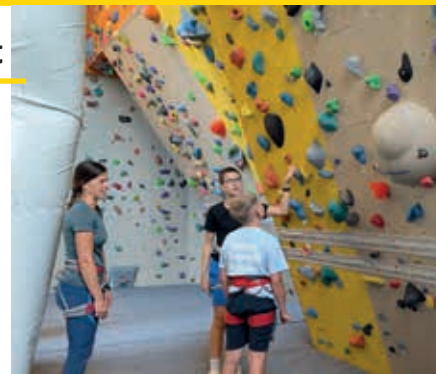
Bei den Schulworkshops können die Jugendlichen verschiedene Bereiche der Freiwilligenarbeit erleben.

Bislang wurden die Workshops an drei Schulen in der Region abgehalten. Dabei gab es jede Menge inspirierende Begegnungen: Beim Fußballspiel mit Klient:innen der Lebenshilfe verschwanden anfängliche Berührungsängste, beim Roten Kreuz wurde die herausfordernde, aber erfüllende Arbeit im Rettungsdienst erlebbar. Der Vinziladen und der Museumsverein öffneten Türen in die soziale und kulturelle Freiwilligenarbeit, beim Alpenverein durften die Jugendlichen klettern und gleichzeitig spannende Einblicke in die Arbeit der Bergrettung gewinnen. Auch Feuerwehr, Naturschutzjugend, Berg- und Naturwacht sowie die Behindertenselbsthilfegruppe zeigten praxisnah, wie vielfältig freiwilliges Engagement sein kann. „Die Begeisterung war bei