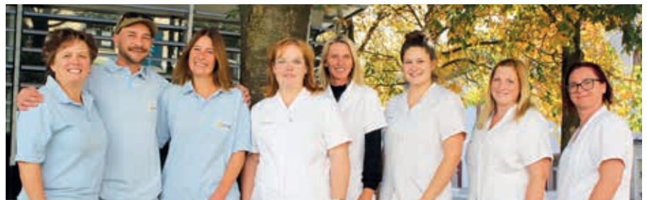
Neue Mitarbeiter:innen verstärken das Team der Hauskrankenpflege.