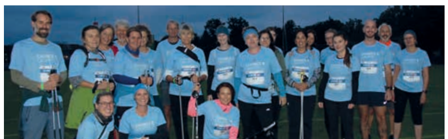
Das Chance B Team beim Social Business Night Run.