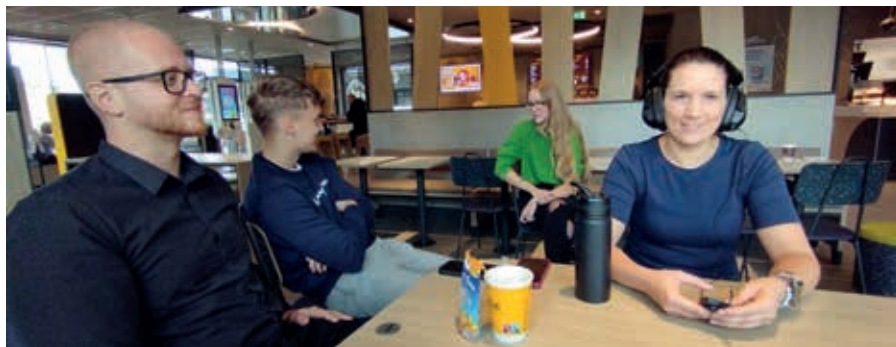
Bei McDonald's in Sebersdorf wurde GERT ausprobiert.