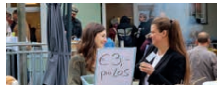
Beim Fest der Chancen wurde erlebbar, was gemeinsam alles gelingen kann.

Es war ein rundum gelungenes Fest, für das sich die Chance B Teams über ihre regulären Aufgaben hinaus mit großem Engagement tatkräftig eingebracht haben.