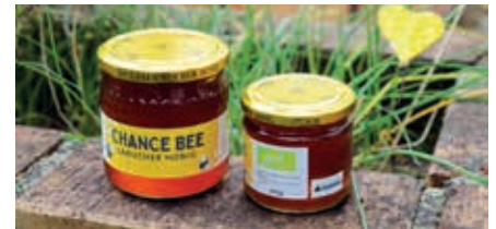
Erste Honigernte am Bio-Bauernhof.

gedeckt werden – ein wichtiger Schritt hin zu mehr Nachhaltigkeit und Regionalität. Das Naturprodukt kommt insbesondere bei der Herstellung von Weihnachtskeksen und weiteren süßen Köstlichkeiten zum Einsatz.