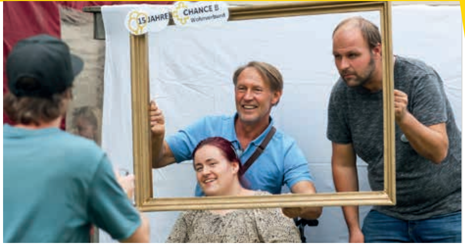
Am Fest gab es für die Gäste einen Foto-Spot mit Nostalgierahmen.