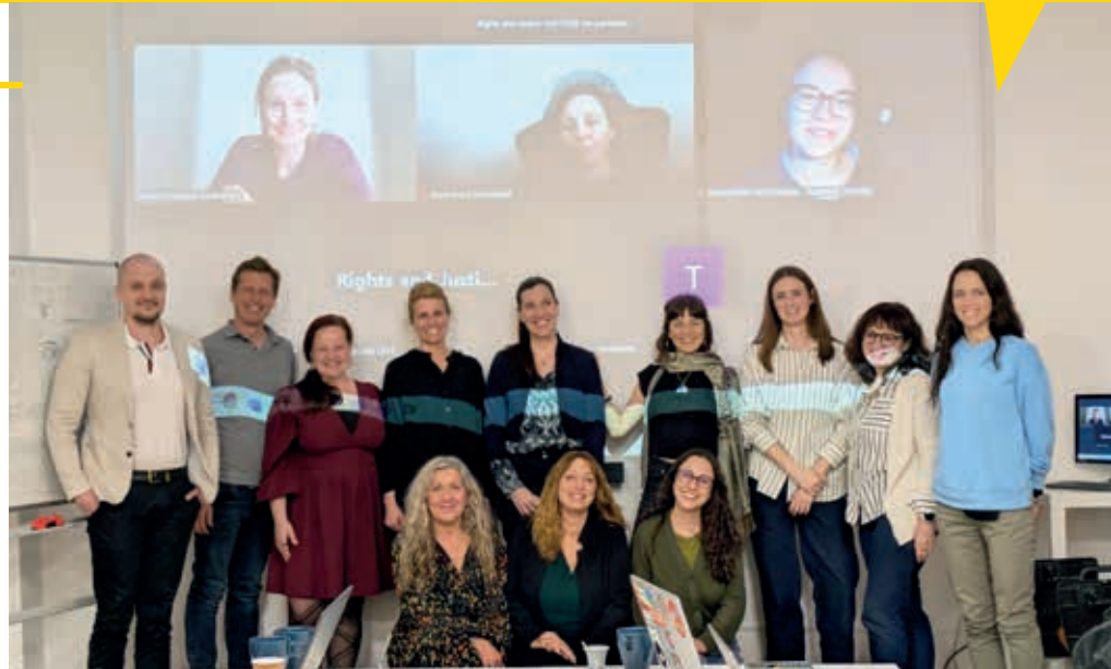
Das Projekt-Team von EQUAL CARE.

Um einen tieferen Einblick in die bestehenden Ungleichheiten zwischen Frauen und Männern zu bekommen, wurden in den Partnerländern umfangreiche Erhebungen durchgeführt. Pflege- und Betreuungskräfte, Angehörige und Arbeitgeber:innen berichteten in Interviews, Umfragen und Gesprächen über ihre Erfahrungen. Der gemeinsame Bericht wurde Ende September 2025 fertiggestellt und zeigt ein klares Bild: Pflege und Betreuung sind in Europa nach wie vor stark weiblich geprägt . Frauen leisten den größten Teil