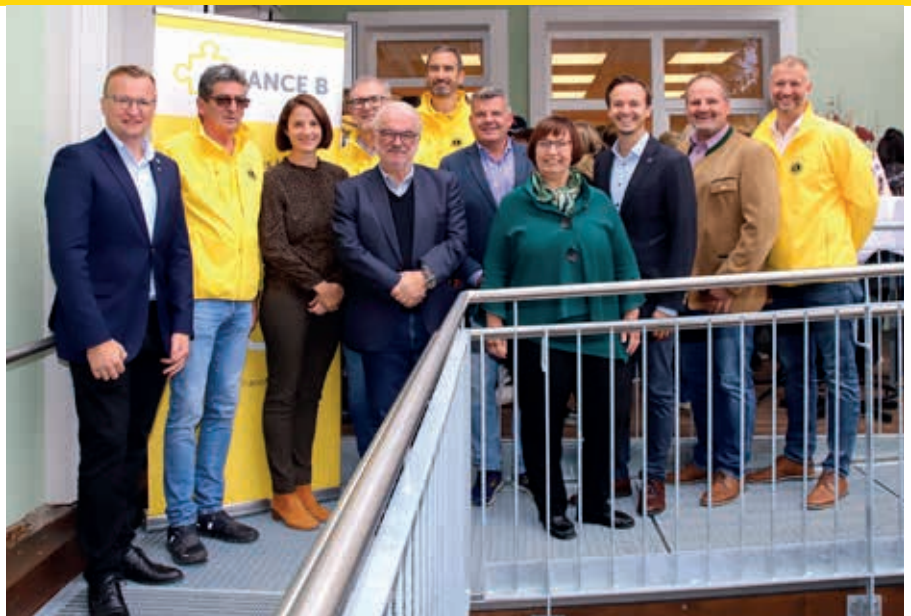
Zusammen freute man sich über die neue Rampe in den Innenhof.

Musik-Einlagen, eine Tombola mit vielen Preisen, eine Waffelstation und selbst gekochtes Essen von Mitarbeiter:innen und Kund:innen der Chance B Tageseinrichtung in Peugen machten erlebbar, was zusammen alles gelingen kann. Kund:innen von selba sprachen offen über ihr Leben mit einer psychischen Erkrankung, um die Situation von Betroffenen besser zu verstehen und zur Enttabuisierung des Themas beizutragen. Auch verschiedenste Aktionen wie Riesenseifenblasen sorgten für ein heiteres Miteinander.