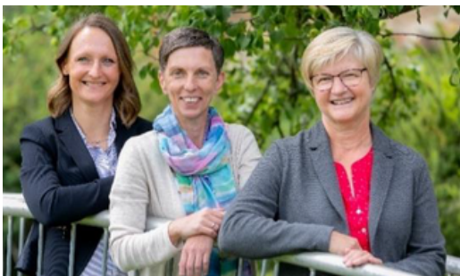
PROJEKTEAM „LEBEN MIT DEMENZ“

Zu den ehrenamtlichen Tätigkeiten zählen Gesellschaft leisten, Spaziergänge, Gesellschaftsspiele spielen, singen, vorlesen, gemeinsam Essen zubereiten, einfach gemeinsam Zeit verbringen. Es wird speziell auf die Wünsche und Bedürfnisse der zu betreuenden Personen eingegangen. Beim Ehrenamt werden keine routinemäßigen Hausarbeiten und Pflegetätigkeiten übernommen.