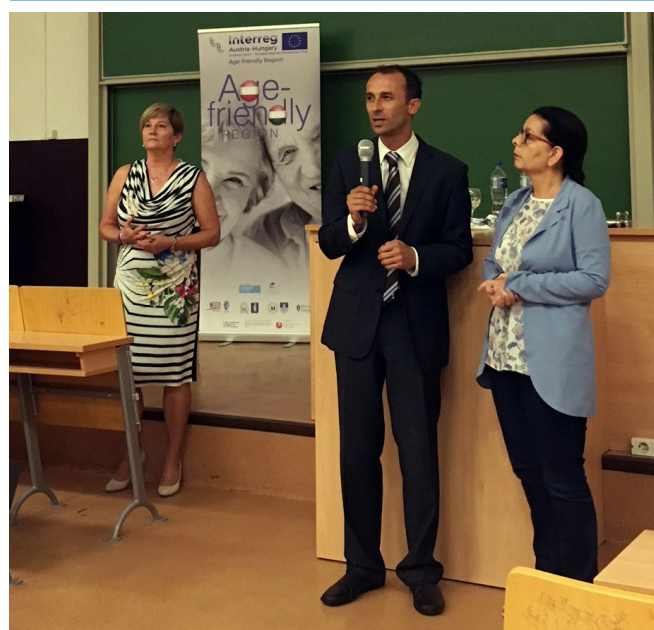
Medieninhaber und Herausgeber: Projekt „Age-friendly Region“ Chance B Firmengruppe, Franz-Josef Str. 3, 8200 Gleisdorf www.chanceb-gruppe.at

Das Vereinigte Institut für Gesundheitswesen und Soziales Győr (EESZI), Chance B aus Österreich, das European Centre for Social Welfare Policy and Research (Wien), das Szombathelyer Pálos Károly Sozialdienstleistungszentrum sowie das Zalaegerszger Betreuungszentrum nehmen als Partner am Projekt teil. Die grenzüberschreitende Kooperation ermöglicht es, dass die Fachleute beider Länder unter Anwendung ihres Wissens und ihrer Erfahrungen gemeinsam ein Modell für die an der Umsetzung beteiligten Organisationen ausarbeiten, mit dessen Hilfe die in Österreich und Ungarn wohnenden älteren Menschen so lange wie möglich selbständig und autonom in ihrer gewohnten Umgebung leben können. Zur Verwirklichung dieses Ziels wird eine neue Dienstleistung – das Case Management für ältere Menschen – mit einem gemeinsamen Konzept angeboten. Dabei werden in den fünf Projektregionen Erkenntnisse gewonnen, die in die Planung und Steuerung der regionalen Gesundheits- und Sozialsysteme rückwirken sollen. ■